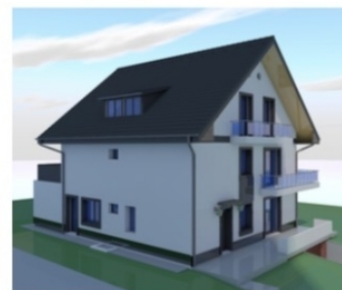
Utcafront felüli képek