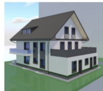
Hátsó kert felüli képek